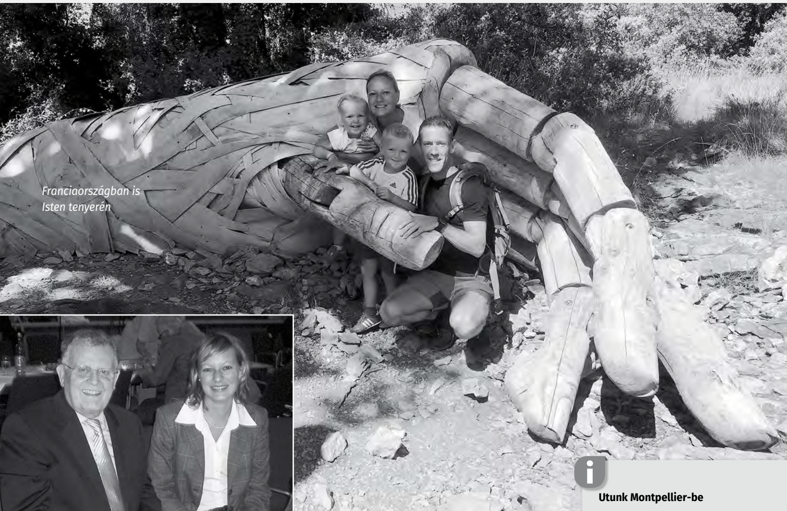
Franciaországban is Isten tenyerén

Az egykori politikai szerepvállalás: a képen Erwin Teufellel, Baden-Württemberg tartomány egykori miniszterelnökével