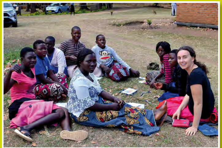
Beszélgetés kiscsoportban a bibliai történetről