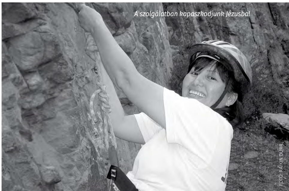
A szolgálatban kapaszkodunk Jézusba!

Az egyik közép-ázsiai országban megismertünk egy helyi misszionáriusnőt, aki olyan intenzív szeretettel és odaadással forgolódott az emberek között, hogy mindenki vonzó-