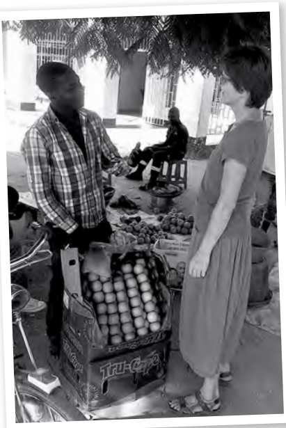
Vásárlás az út szélén