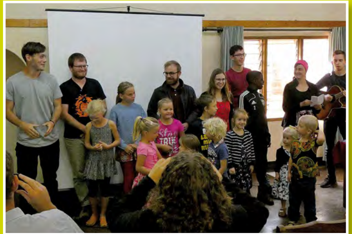
Az impact-csoport énekel a gyerekekkel