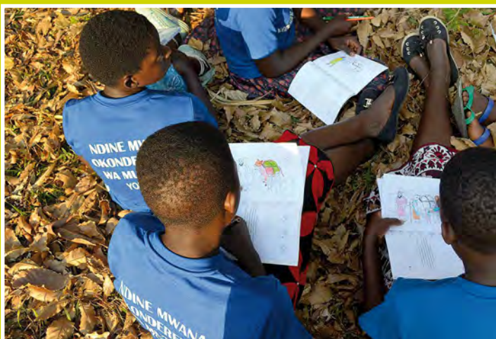
Ruth történetének színezése